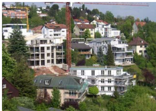
Wohnen am Esslinger Burghang