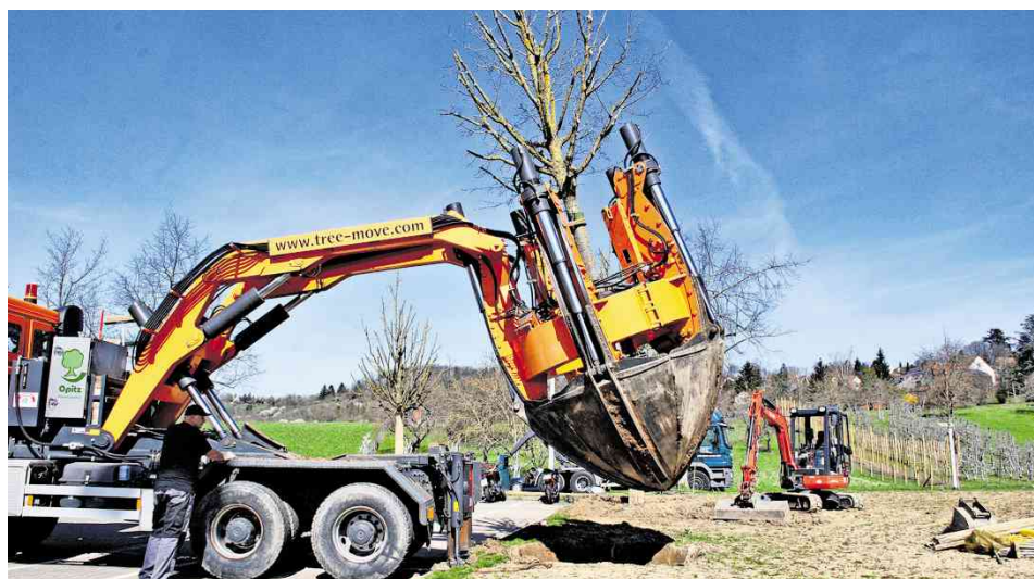
Statt zu fällen wurden im Greut Bäume verpflanzt: Sieben Feldahorne entlang der Alexanderstraße kamen auf das Gelände des Schelztor-Gymnasiums

Verkehrsanbindung: In unmittelbarer Nähe zum Baugebiet befindet sich eine Bushaltestelle sowie öffentliche Parkplätze. Vom Bahnhof in Esslingen sind mit dem ICE, der Regional- oder S-Bahn alle Richtungen erreichbar. Mit dem Auto sind zudem die Bun-