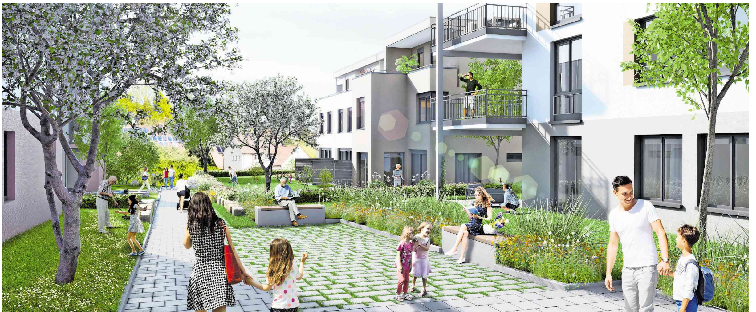
„Das neue Greut“ ist als autofreies und familienfreundliches Quartier geplant, das mit seinen Aufenthaltsflächen ein ansprechendes Wohnumfeld für alle Generationen bietet.